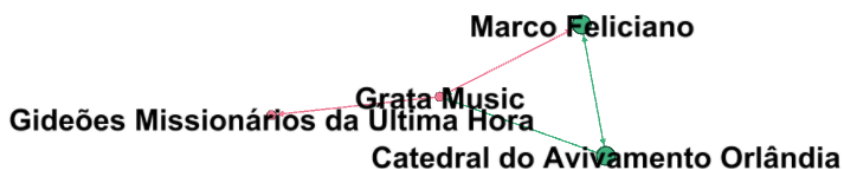
Imagem 02 - Rede de curtidas Marco Feliciano (nível 1)

Os dados sociométricos mostram uma rede que, apesar de atingir um público grande de seguidores (quase dois milhões e quinhentos mil de seguidores), tem poucos nós (17) dentro do Facebook, com baixo índice de conexão (65 arestas). O grau médio de curtidas entre os nós é de quase quatro curtidas entre si (3,824), formando uma rede de diâmetro 3 e de baixa modularidade (0,247), o que indica amplitude de seguidores com baixa conexão entre si.